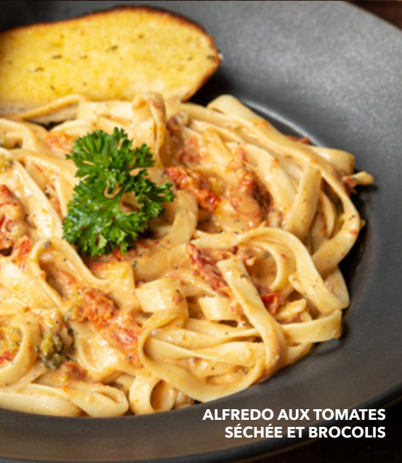
ALFREDO AUX TOMATES SÉCHÉE ET BROCOLIS

SÉLECTION DE PÂTES Spaghetti, fettuccine, fusilli.