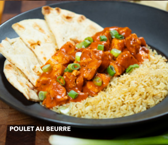
POULET AU BEURRE