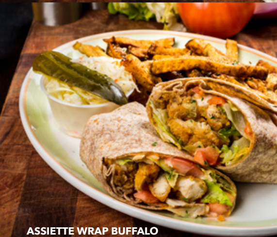
ASSIETTE WRAP BUFFALO