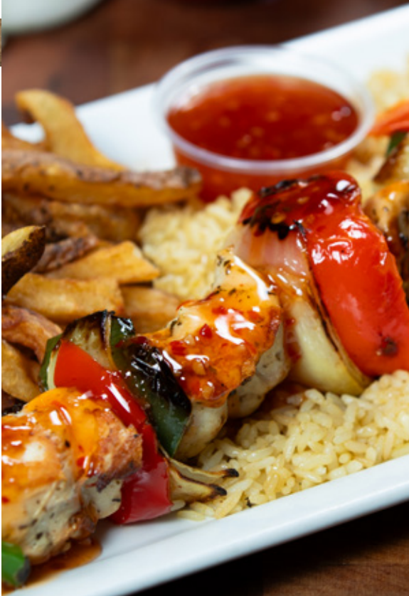
BROCHETTE DE POULET THAI