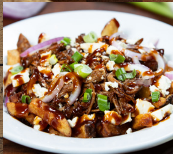
POUTINE PORC ÉFFILOCHÉ