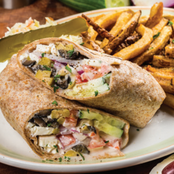
ASSIETTE WRAP SALADE GRECQUE