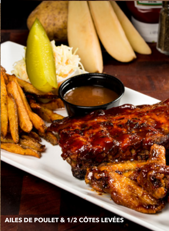
AILES DE POULET & 1/2 CÔTES LEVÉES