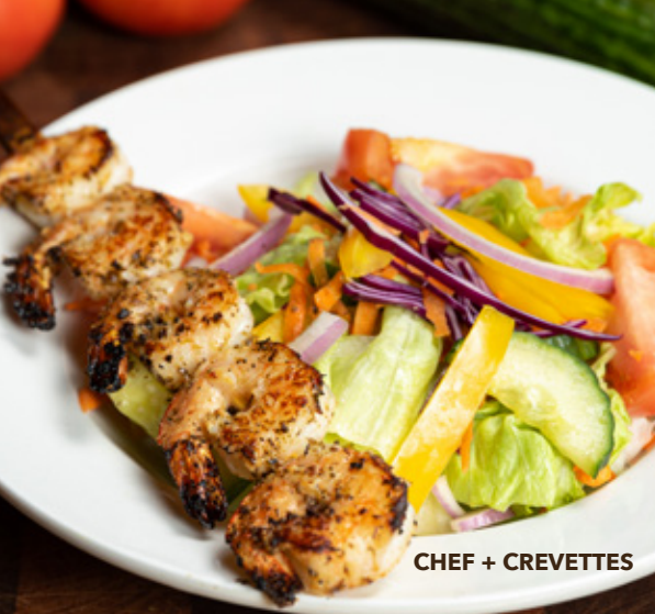
CHEF + CREVETTES