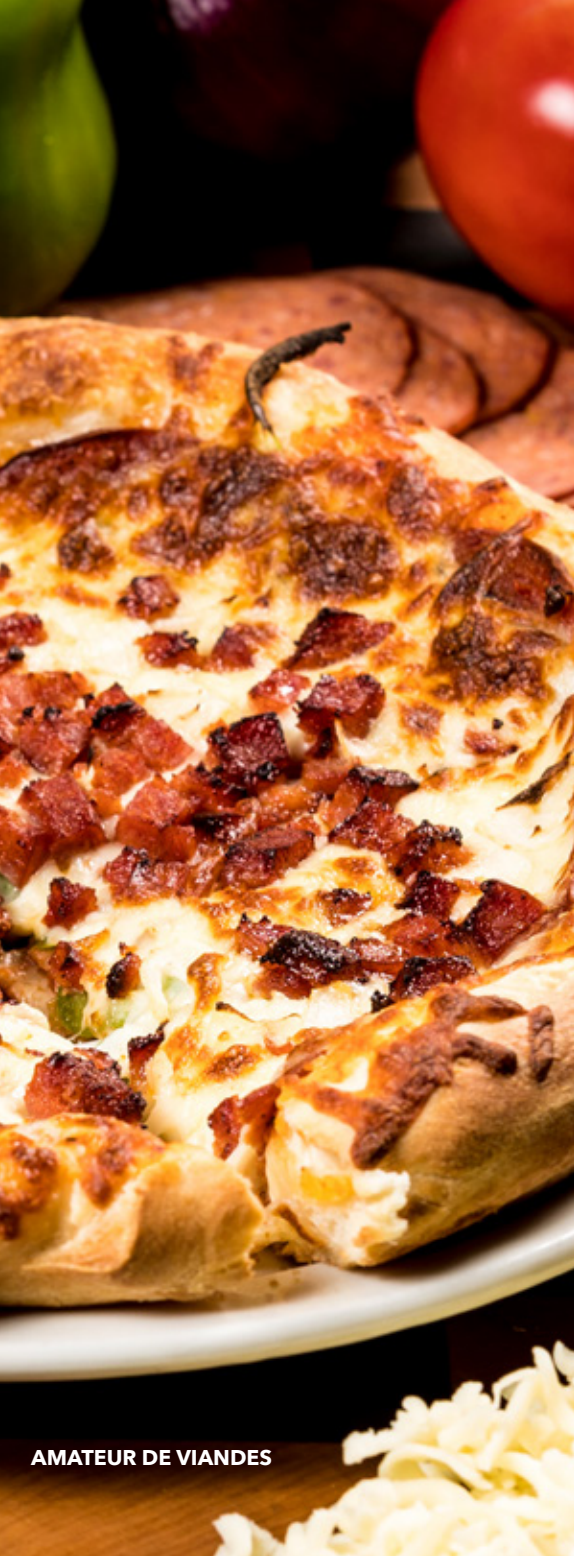
AMATEUR DE VIANDES